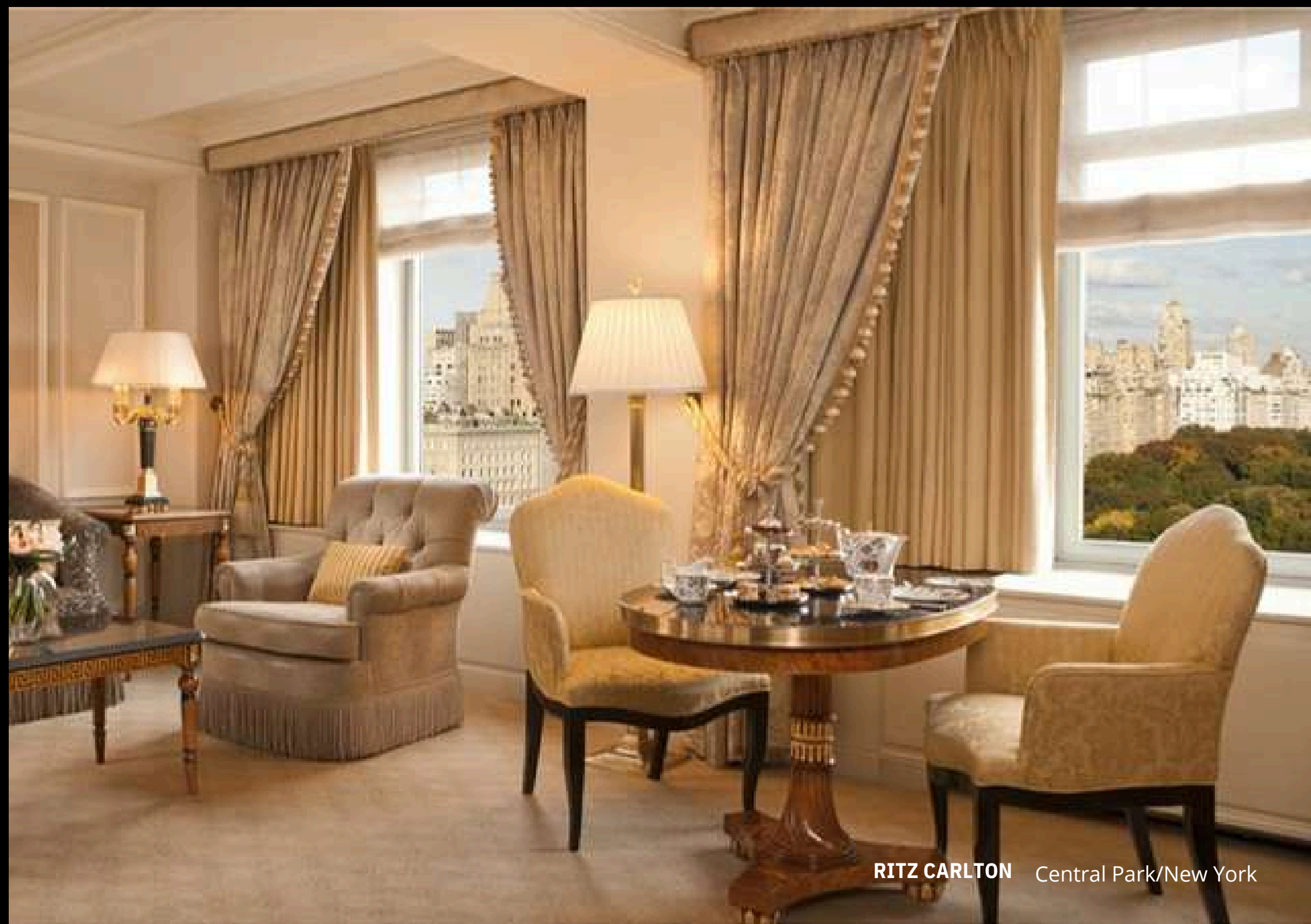
RITZ CARLTON Central Park/New York

Azimut Benetti Yachts - Italy San Lorenzo Yachts - Italy Viudes Yachts - Spain Mondomarine Yachts - Italy Trinity Yachts - USA